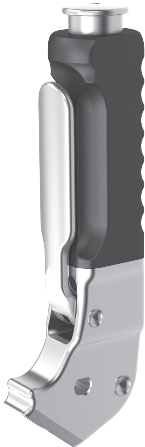
1 LET30400T CONDUIT™ ATP HANDLE